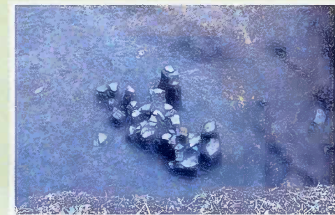
国分寺愛宕塚古墳

福島県からの要請を受け、当財団では平成25年度から東日本震災復興事業に伴う埋蔵文化財発掘調査の協力を行っています。調査に協力した遺跡の中から本県では調査例の少ない弥生時代のムラと、奈良・平安時代の製鉄遺構群の調査成果を紹介します。