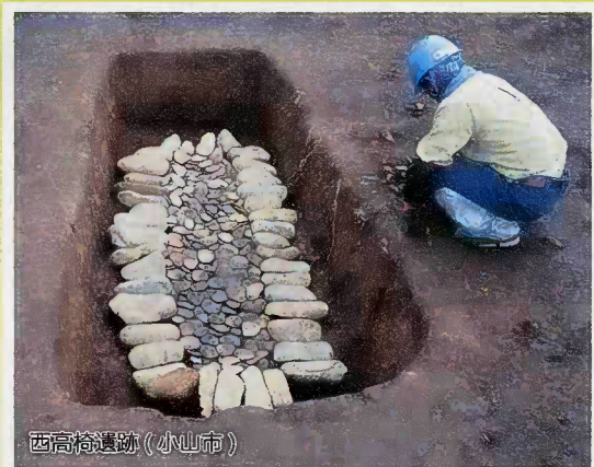
西高椅遺跡 (小山市)