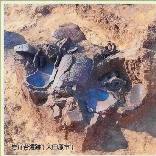
岩舟台遺跡 (大田原市)