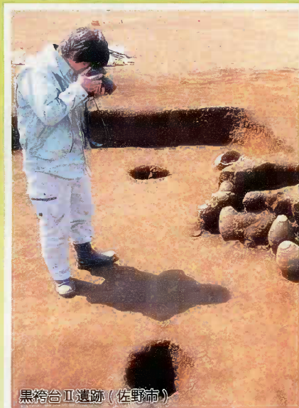
黒袴台Ⅱ遺跡 (佐野市)