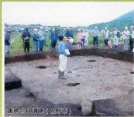
黒袴台Ⅱ遺跡 (佐野市)