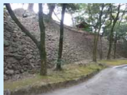
本丸南側の高石垣