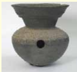
須恵器罏（西高椅遺跡）