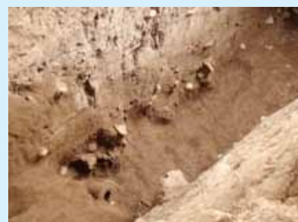
西堀堀底付近出土の瓦（東から）