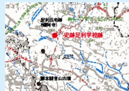
外城中台遺跡位置図