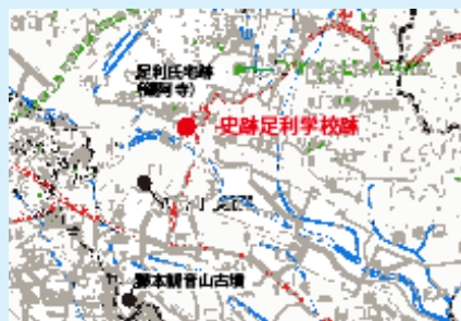
下野国分寺跡の位置