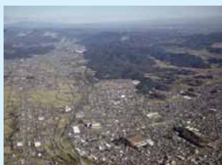
南方上空から唐沢山城跡を望む