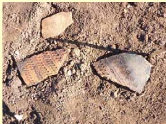
出流原式土器 出土状況