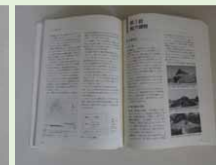
「発掘調査のてびき」