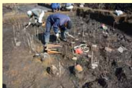
たくさん出土する瓦や須恵器