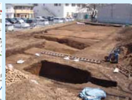
横穴式石室掘り方