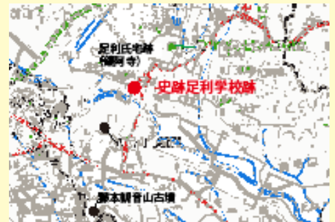
くろま橋遺跡の位置

黒袴台遺跡は、佐野市の三轟山西麓に位置します。かつては西側に越名沼が広がっていました。平成9・10年に発掘調査が行われ、遺跡の南半分の様子が明らかになりましたが、平成25年からは北半分の地区を発掘調査しています。縄文時代、古墳時代、平安時代、室町時代の遺構、遺物が発見されていますが、特に縄文時代早期の遺物が多く発見されています。早期は今から約12,000年前から7,000年前の時代で、土器は底が尖っているのが特徴です。黒袴台遺跡の土器は、栃木県から茨城県北・中部にかけて固有に分布しているもので、「出流原式」と呼ばれており、約8,500年前のものと考えられています。他にも「田戸上層式」と呼ばれる南関東に多い土器が発見されているので、他の地域との比較研究が期待されます。この時代の石器には片刃石器、石鏃がみられます。片刃石器は片面にだけ加工しているのが特徴です。土掘り具としての使いみちが考えられますが、もう少し時代が下ると石斧に取って代わられると考えられています。黒袴台遺跡では、地元の石であるチャートの他に、黒曜石でできた石鏃が発見されています。黒曜石は黒いガラスのような石で、矢板市高原山、信州和田峠、伊豆神津島などで産出し、交易などで持ち込まれたものです。しかも黒袴台遺跡では細かい破片も多数発見されていることから、石器を製作していたと考えられます。このような多量の土器の消費、交易、石器製作が行われた黒袴台遺跡は、縄文時代早期の拠点となるような大きなムラであったことが想定できます。