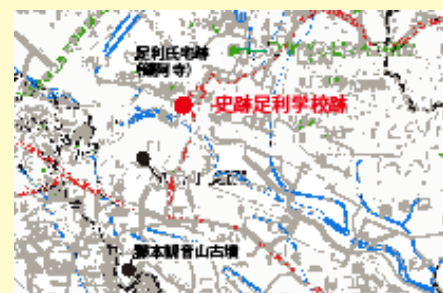
黒袴前遺跡の位置

奈良・平安時代、三疊山周辺は須恵器や瓦の一大生産地でした。人知れず埋もれている窯は、黒袴前遺跡のあたりにはまだたくさんあるのかもしれません。