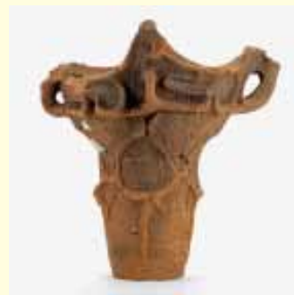
縄文土器（北ノ内遺跡）