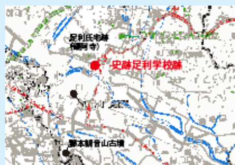
唐沢山城跡位置図