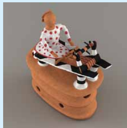
人物埴輪7(地機)彩色復元