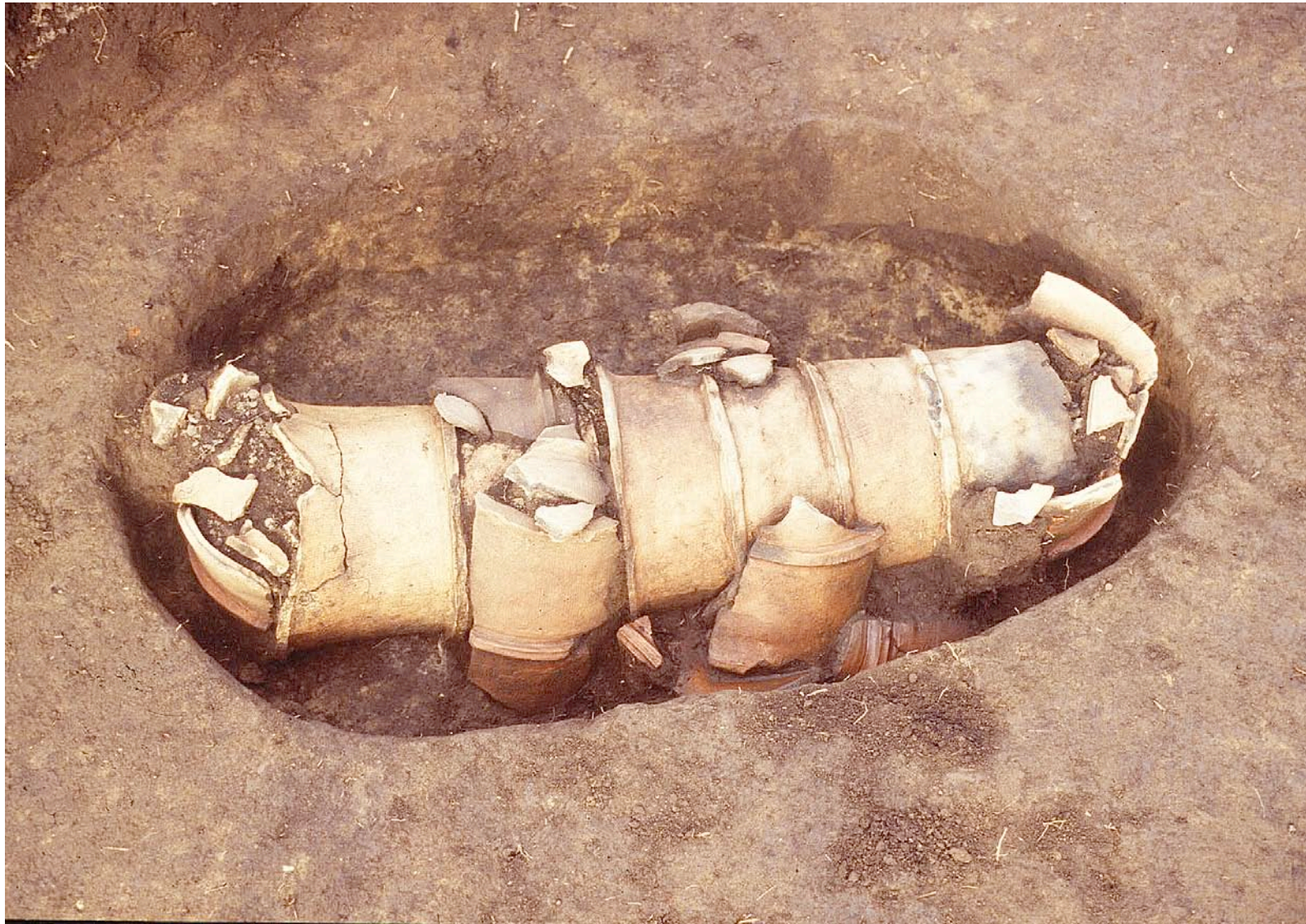
「はにわ」で作ったお墓（埴輪棺）