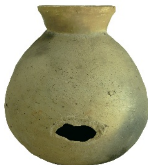
せんこう ど き 穿孔土器

ひようめん かご もよう 土器の表面に籠の模様のつい ぜんこくてき めずら ている全国的も珍しい土器なの で、よくみてね。