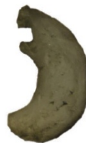
ど せい まが た ま 土製勾玉

で ぼ 土器のいちばん出っ張っている あな ところに穴があいてるよ。どうし てかな？