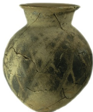
ひ か ご ど き 被籠土器

花の木町遺跡は、古墳時代でも、今から 1600 年くらい前（古墳時代前半）のムラ の跡です。発掘調査の結果、 たてあなじゆうきよあと けん ど き ど せい まが た ま 竪穴住居跡 8 軒と、土器や土製勾玉など古墳時代に使 われたものがたくさん残っていました