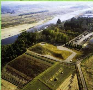
那須八幡塚古墳(那珂川町)