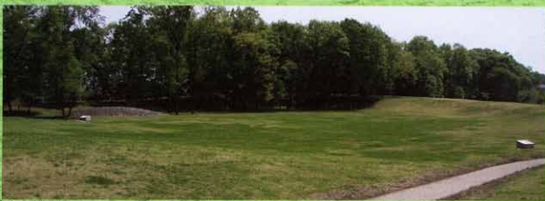
寺野東遺跡(小山市)