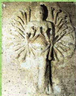
大谷磨崖仏(大谷観音)(宇都宮市)