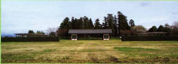
しも野国庁跡(栃木市)