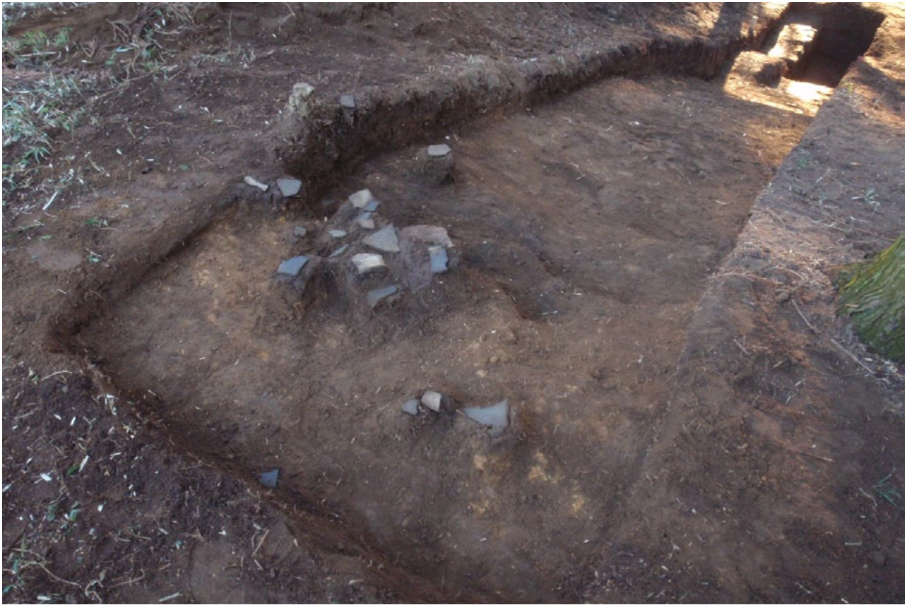
古墳の上から出土した土器（北東から）