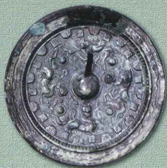
画文帯四獣鏡（駒形大塚古墳） 那珂川町教育委員会蔵