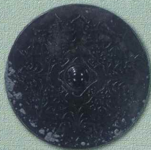
き鳳鏡（那須八幡塚古墳 複製） 那珂川町教育委員会蔵