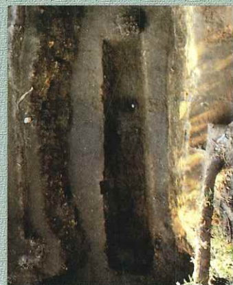
埋葬主体部（茂原愛宕塚古墳）