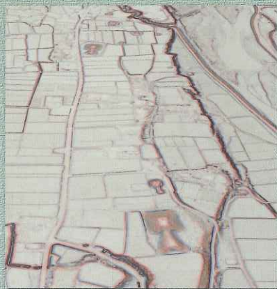
赤色立体図（侍塚古墳群）