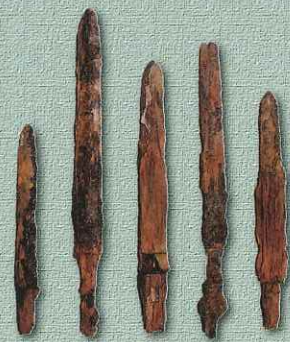
鉄剣（山王寺大樹塚古墳） 栃木市教育委員会蔵