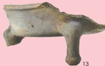
小泉分校裏遺跡出土須恵器香炉 13