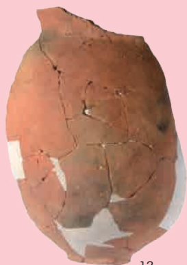
上侍塚古墳前方部出土土器 12