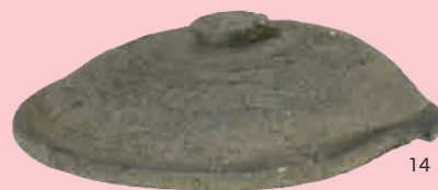
本沼窯跡群出土須恵器蓋 14