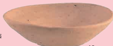
宝性寺西遺跡出土かわらけ 15