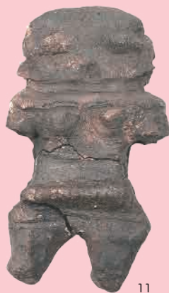
竹下遺跡出土土偶 11